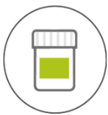
罐装 250g & 500g