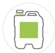
BIDON 20 L