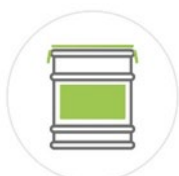
FÛT de 30 Kg

Merci de confirmer, auprès de votre interlocuteur commercial, les informations concernant l'emballage notamment son volume et sa disponibilité. En effet, celles-ci peuvent varier en fonction du site de production.