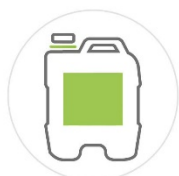
BIDON de 20 Kg