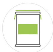
FÛT de 210 Kg