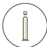
30g / 30cc 针筒包装