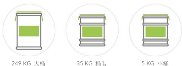
249 KG 大桶