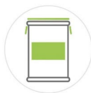
200 Kg 大桶