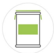
200 L BIDON