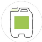
20 kg KANISTER