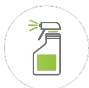
750 ml 喷瓶 / *1L 喷瓶