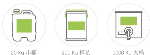
20 Kg 小桶